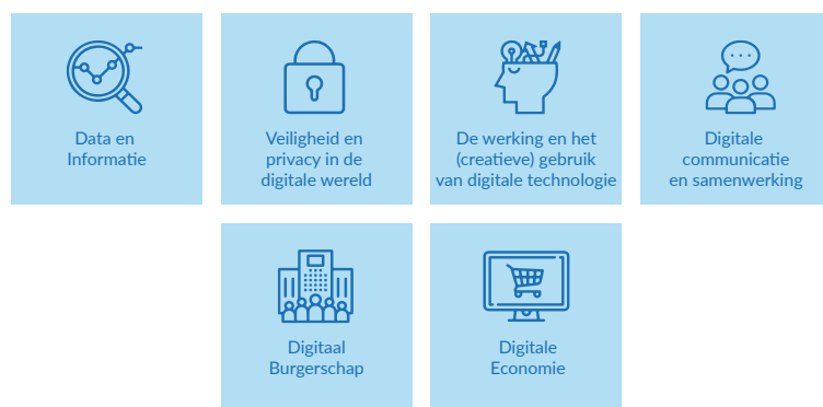
Figuur 1: overzicht van de grote opdrachten

Op basis van de visie zijn zes grote opdrachten te formuleren. De grote opdrachten omschrijven de grote thema's die relevant zijn voor het leergebied digitale geletterdheid. In de grote opdrachten komen alle elementen vanuit de visie samen, volgens een holistische benadering. In de grote opdrachten worden de vier perspectieven verbonden aan de vier domeinen die hierboven beschreven staan.